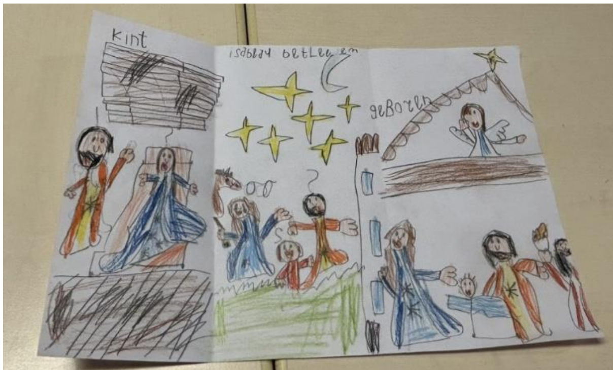
Close-listening in groep 3C adhv het Kerstverhaal